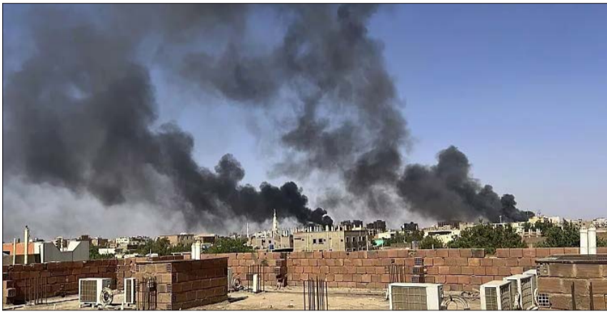
Εκτακτες απομακρύνσεις, κατήγγειλε, ενώ ζήτησε να παραδοθεί ανθρωπιστική βοήθεια στο Σουδάν «με ή χωρίς εκεχειρία».

Η σύγκρουση έχει μετατρέψει την ήδη υπάρχουσα ανθρωπιστική κρίση σε «πραγματική καταστροφή», προειδοποίησε ο Άμπντου Ντίενγκ , συντονιστής της ανθρωπιστικής βοήθειας για το Σουδάν. Για τον Κενυάτη πρόεδρο Ουίλιαμ Ρούτο η κρίση έχει φτάσει σε «ένα καταστροφικό επίπεδο». Οι δύο στρατηγοί αρνούνται «να εισακούσουν τις εκκλήσεις» της διεθνούς κοινότητας,