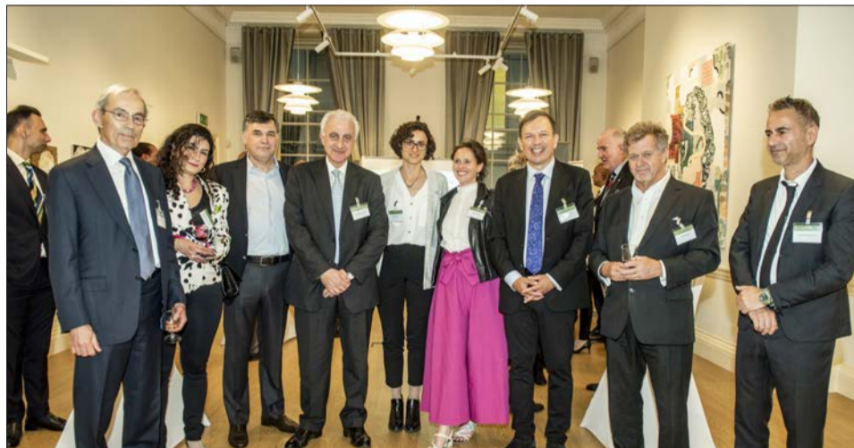
Από την εκδήλωση της CEF στο Λονδίνο

Πολλοί, όμως, είναι οι παράγοντες που απειλούν τα ιδιαίτερα οικο-