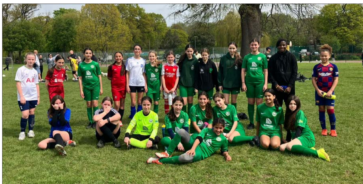
UNDER 12 GIRLS