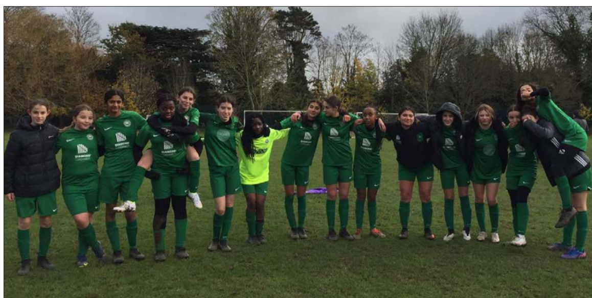
UNDER 15 GIRLS