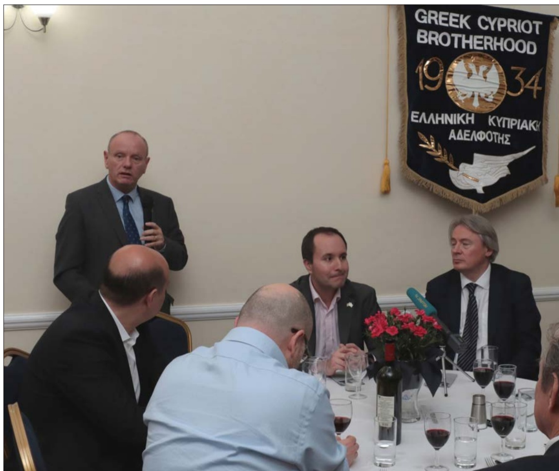
Ο Συντηρητικός βουλευτής της περιοχής Mike Freer κατά την ομιλία του στα εγκαίνια

τητας και ιδρύθηκε το 1934. Ο κ. Καραολής είπε «όπως οι συνθήκες και οι ανάγκες της κυπριακής κοινότητας και της Κύπρου άλλαξαν, το ίδιο και οι στόχοι, οι εκδηλώσεις και οι εκστρατείες της Αδελφότητας», λέγοντας ότι η Αδελφότητα παρέχει τώρα μια σειρά κοινωνικών, πολιτιστικών και εκπαιδευτικών εκδηλώσεων για την παροικία. Είπε ότι η Αδελφότητα βρίσκεται επίσης στο επίκεντρο των αγώνων της παροικίας για τον τερματισμό της τουρκικής κατοχής και την επανένωση της Κύπρου. Κλείνοντας, προέτρεψε την ομογένεια, να κάνει χρήση των εγκαταστάσεων της Αδελφότητας για