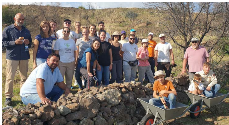
Επιτόπου δράση της οργάνωσης CEF για προστασία του φυσικού περιβάλλοντος της Κύπρου

Αν η αποστολή του CEF σε έχει εμπνεύσει και θα ήθελες να γίνεις μέρος της θετικής αλλαγής για την Κύπρο, επικοινωνήσε μαζί μας ώστε μαζί να στοχεύσουμε για την διατήρηση και αναγέννηση του πιο πολύτιμου αγαθού του νησιού μας: Το φυσικό του Περιβάλλον.